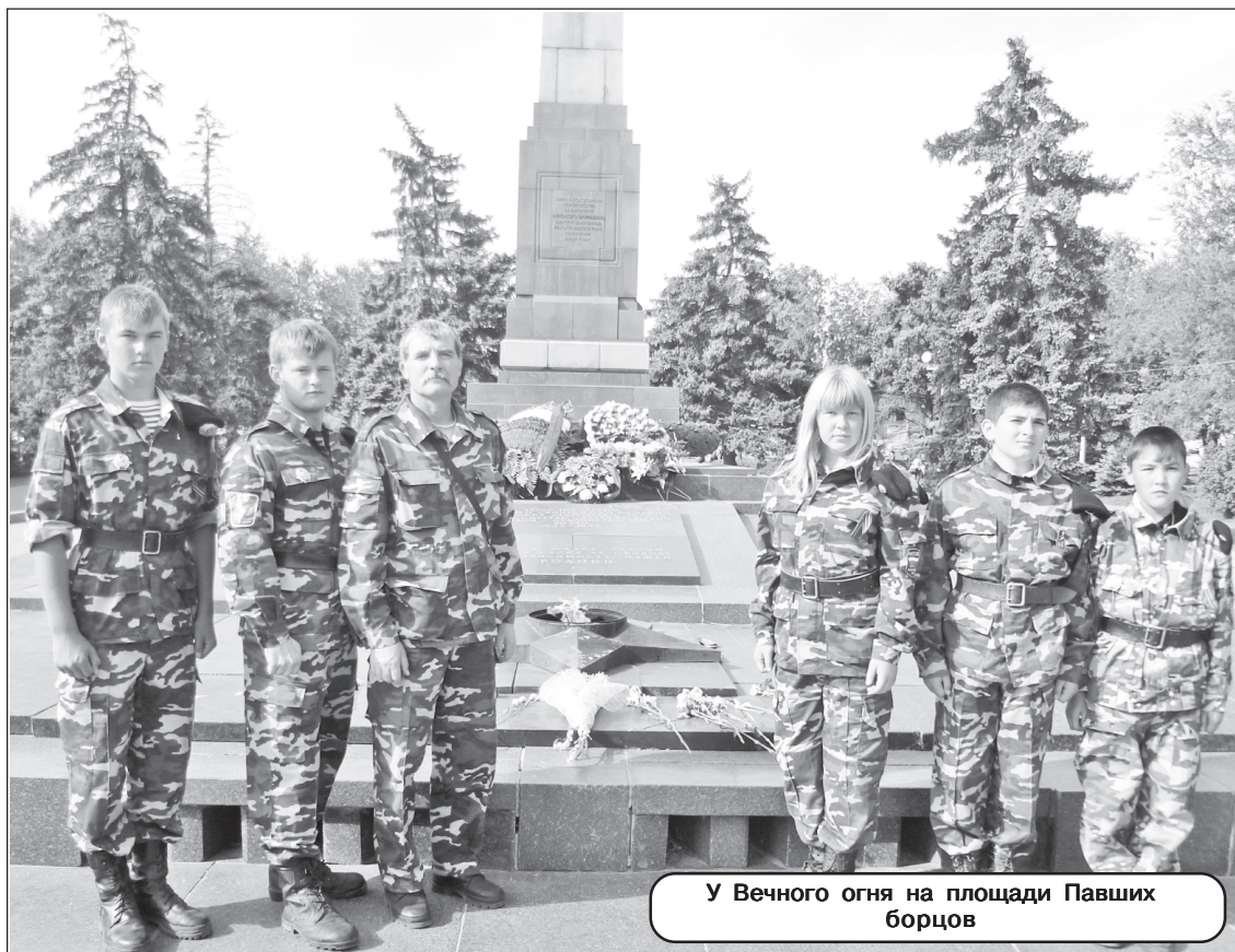
У Вечного огня на площади Павших борцов