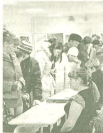
шей ярмарки 21 ищущий работу приглашен на собеседование работодателями.

Состоявшаяся ярмарка еще раз показала, что предприятиям по-прежнему нужны рабочие руки. Самыми востребованными остаются электросварщики, каменщики, монтажники, плотники-бетонщики, водители 1-го класса, машинисты различной техники и медицинские работники. По результатам прошед-