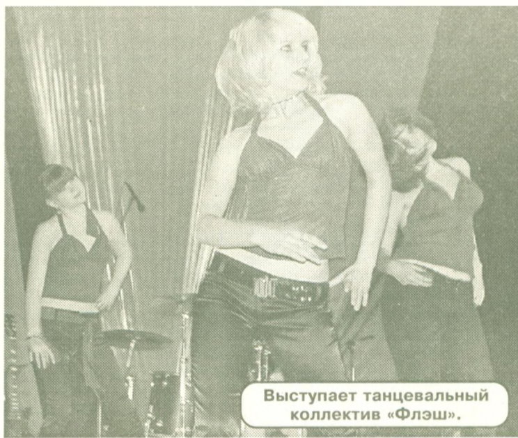
Выступает танцевальный коллектив «Флэш».