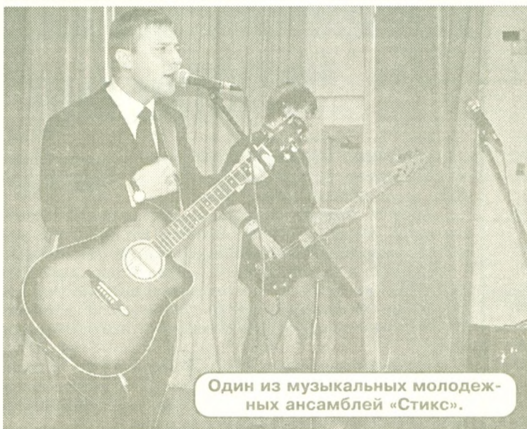
Один из музыкальных молодежных ансамблей «Стикс».

Годом молодежи, и мы разрабатываем свою программу, но не все идеи можно реализовать. Конечно, хотелось бы приобрести новую аппаратуру, наше здание не отвечает сегодня всем современным тре-