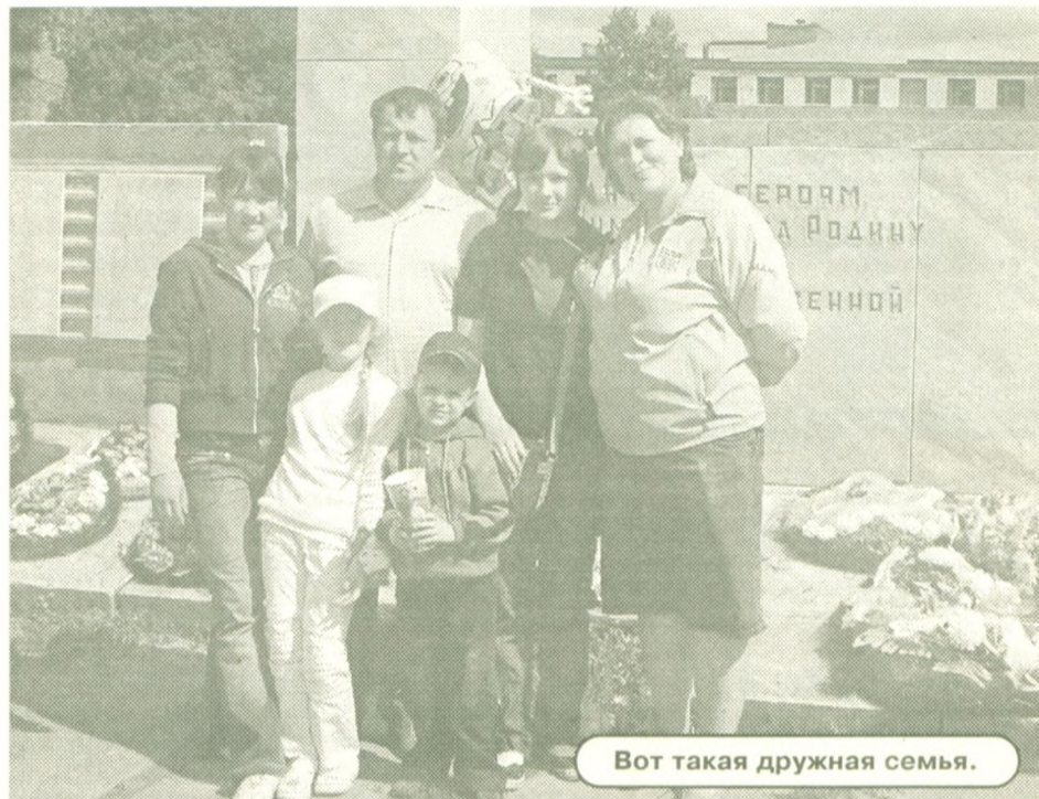
Вот такая дружная семья.