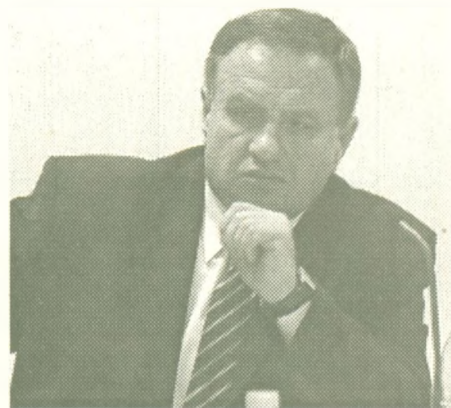
Михаил ИГИТОВ, глава города Мегиона:

— Насущных проблем накопилось в сфере предпринимательства достаточно. Понимаю, что какие-то из них требуют изменений в законодательной базе, но многое зависит и от нашей с вами активности, и гражданской ответственности. Сегодня необходимо выстроить систему взаимодействия городской власти и бизнес-сообщества, тогда возникающие вопросы можно будет решать в рабочем порядке. Считаю, что и предприниматели на добровольной основе для города что-то полезное должны создавать. Будем вместе делать всё, чтобы и вам легче жилось, и городу было лучше.