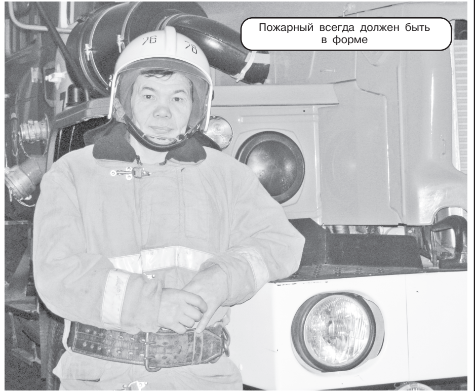
Пожарный всегда должен быть в форме

Вот так, благодаря самоотверженным действиям пожарных была спасена человеческая жизнь. На вопрос, не хотели бы