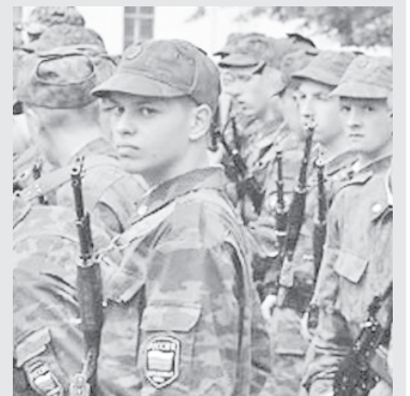
Материалы полосы подготовил Владимир ПЕЩУК

За дополнительной информацией все желающие могут обращаться в отдел военного комиссариата ХМАО-Югры по городу Мегиону.