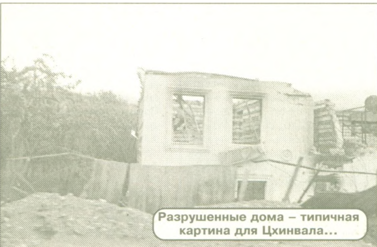
Разрушенные дома – типичная картина для Цхинвала...