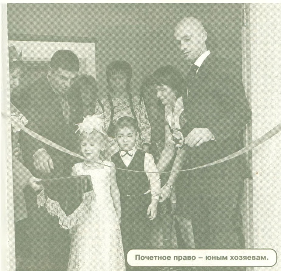
Почетное право – юным хозяевам.