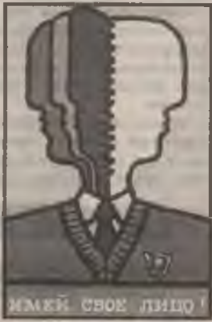
ИМЯЙ СВОЕ ЛИЦО!

тии», многим казалось, что вот, покончили наконец с «монстром», избавились от «диктатуры» ЦК ВЛКСМ, многочисленных обкомов и райкомов, теперь-то молодежь заживет по-другому, да здравствует свобода!