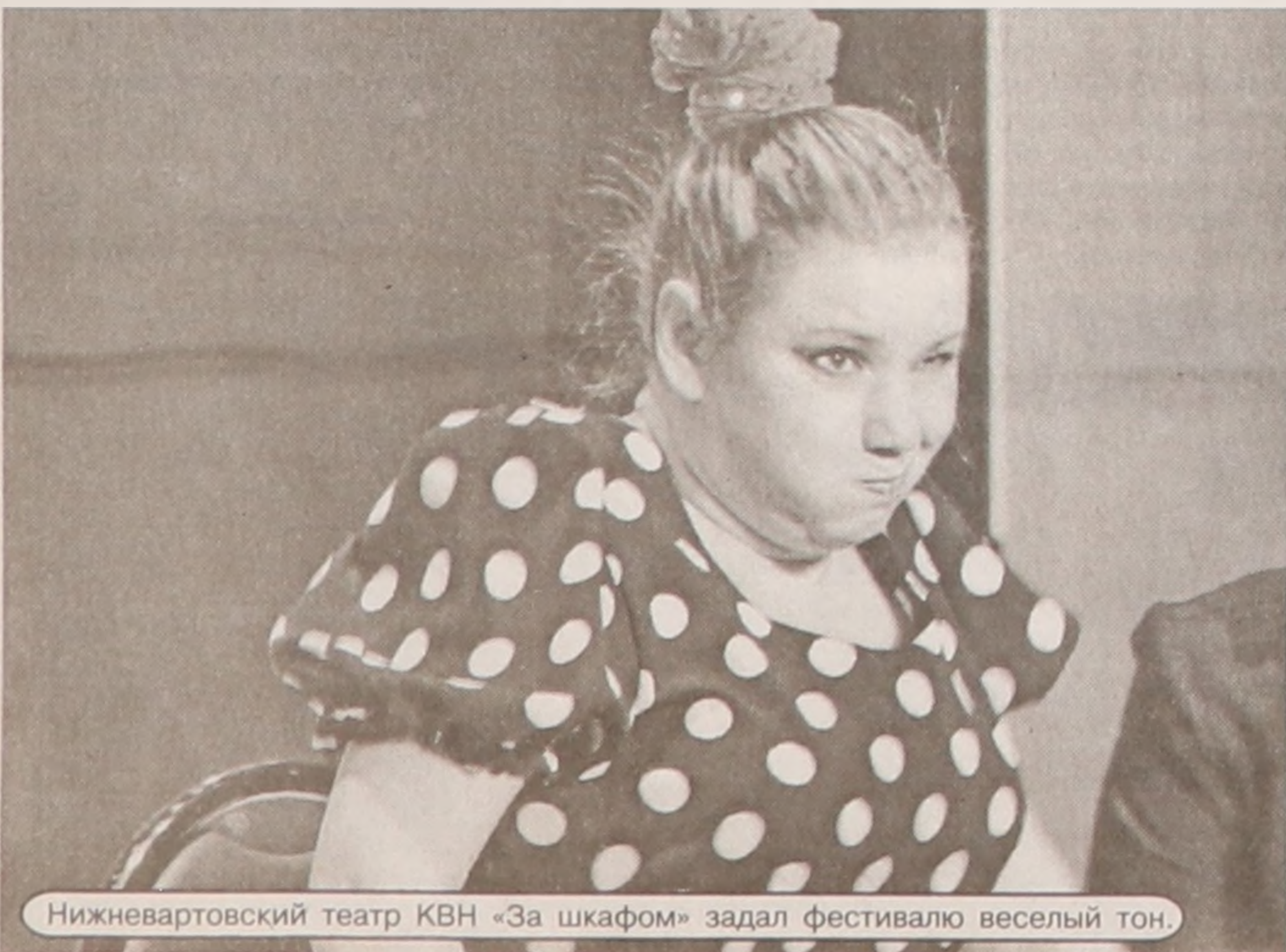
Нижневартовский театр КВН «За шкафом» задал фестивалю веселый тон.