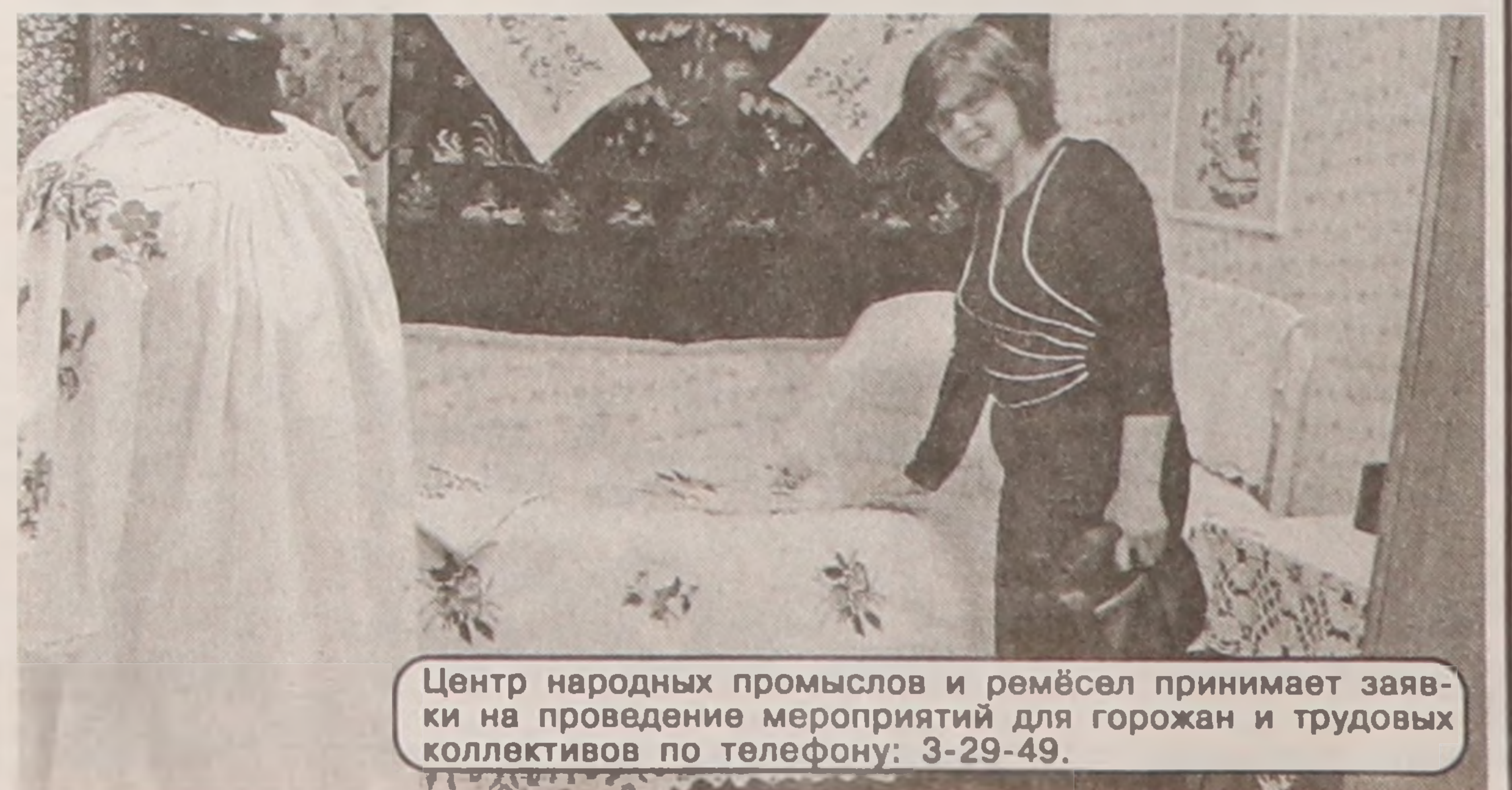
Центр народных промыслов и ремёсел принимает заявки на проведение мероприятий для горожан и трудовых коллективов по телефону: 3-29-49.