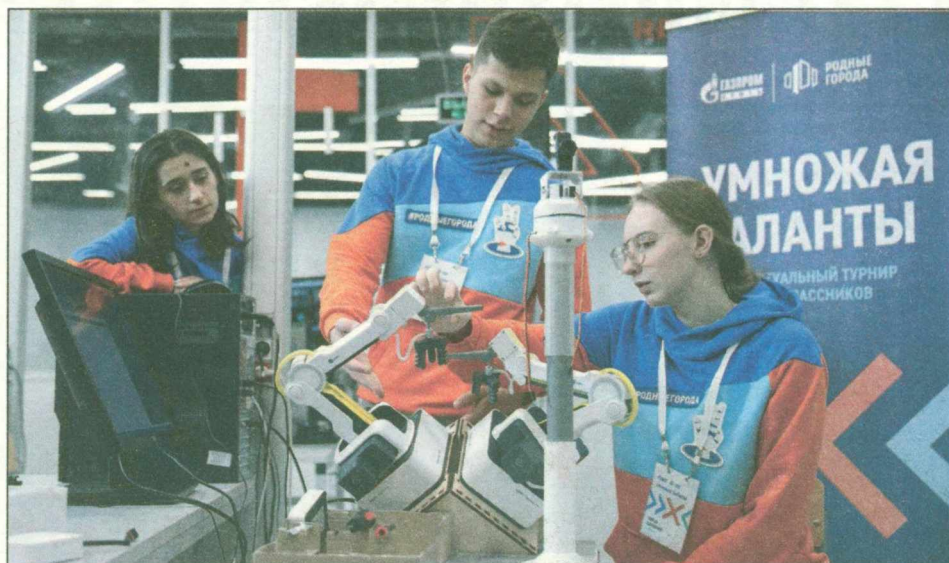
Первого декабря начался прием заявок на участие в интеллектуальном турнире для школьников “Умножая таланты”. Наряду с ребятами из других регионов представить свои проекты смогут и мегионские старшеклассники.