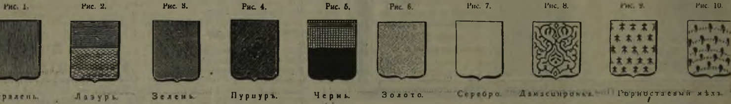
Червлень. Лазурь. Зелень. Пурпур. Чернь. Золото. Серебро. Дамассировка. Горностайный мех.

Об истории этих гербов Вам рассказал с помощью архивных материалов Ваш покорный слуга Л.А. Лазаревский. 28.10.95 г. г. Мегион, ул. Строителей, 3/3, кв.92, телефон: 2-18-20 (домашний).