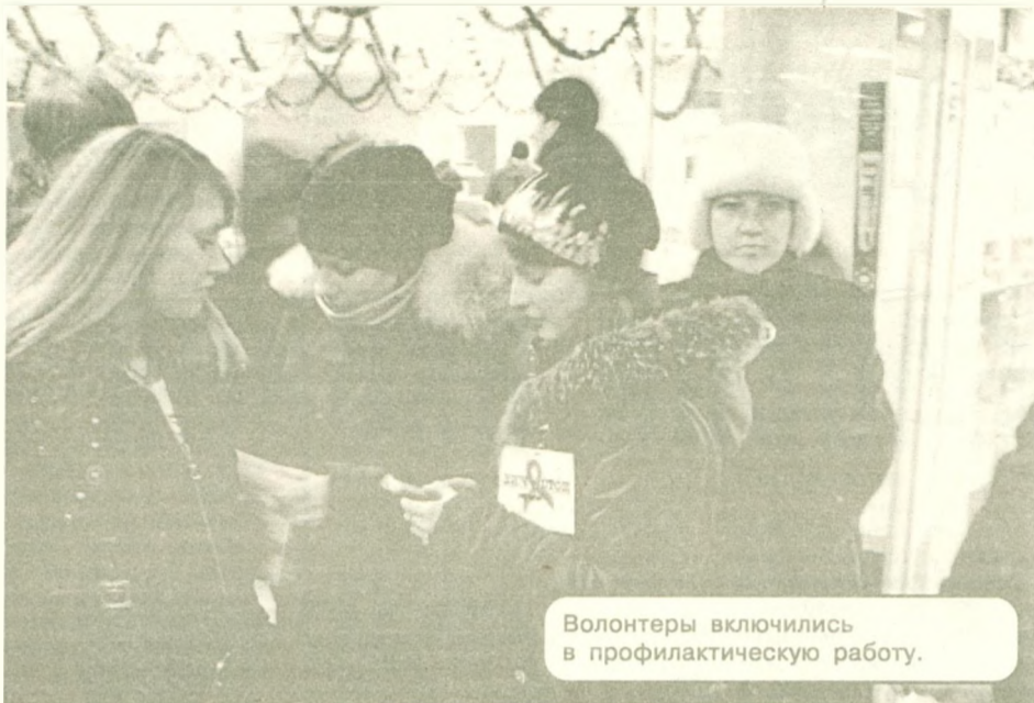
Волонтеры включились в профилактическую работу.

Эти цифры говорят сами за себя, поэтому профилактическая работа с населением сегодня очень важна. Люди должны ясно осознавать, что вич-инфекция распространяется не только в среде наркоманов, но и передаётся половым партнёрам вич-инфицированных наркозависимых. И даже одна случайная связь нормального, вполне добропорядочного человека может привести к заражению инфекцией, панацеи от которой пока нет.