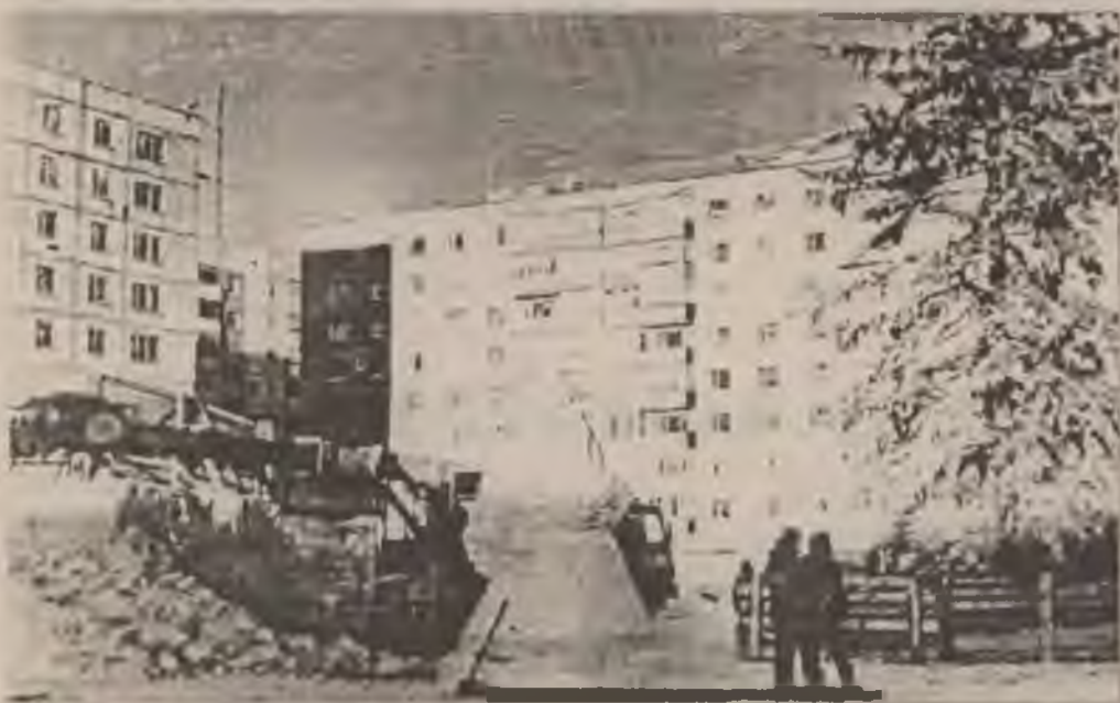
РАСТУТ ГОРОДКИ СНЕЖНЫЕ...