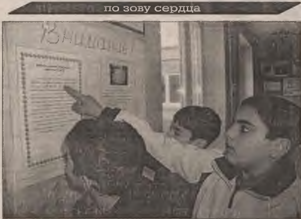
по зову сердца

- Его родители живут в Мегионе, а в Беслане он жил с бабушкой и дедушкой. Мы дружили. Летом, когда я бывал там, любил вместе гонять на велосипедах, купаться, обры-