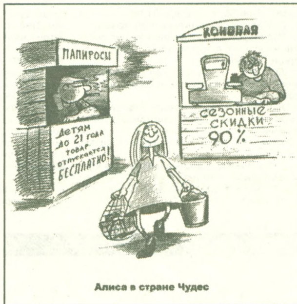
Алиса в стране Чудес

Зима. Сибирь. Томск. Температура -42С. 3 часа ночи. Двое курят на лестничной площадке. Один - в трусах, другой - в трико. Тот, что в трико: - Пойдем на улицу курить. Тот, что в трусах: - Ты что, сдурил, я же без штанов!!! - Да кто тебя ночью-то увидит?