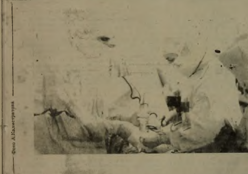
Никто из нас не застрахован от заболевания. И тогда наша жизнь целиком и полностью зависит от умения медиков вернуть нам здоровье, спокойствие, уверенность в будущем. Мы надеемся на руки хирургов, их чувство долга перед обществом. Но общество не всегда оплачивает долг медикам сполна. Бессспорно, что руки хирурга должны быть заняты святым делом, но мысли не должны быть в это время заняты решением житейских проблем. А их у мегонских врачей, к сожалению, тоже отбавля...