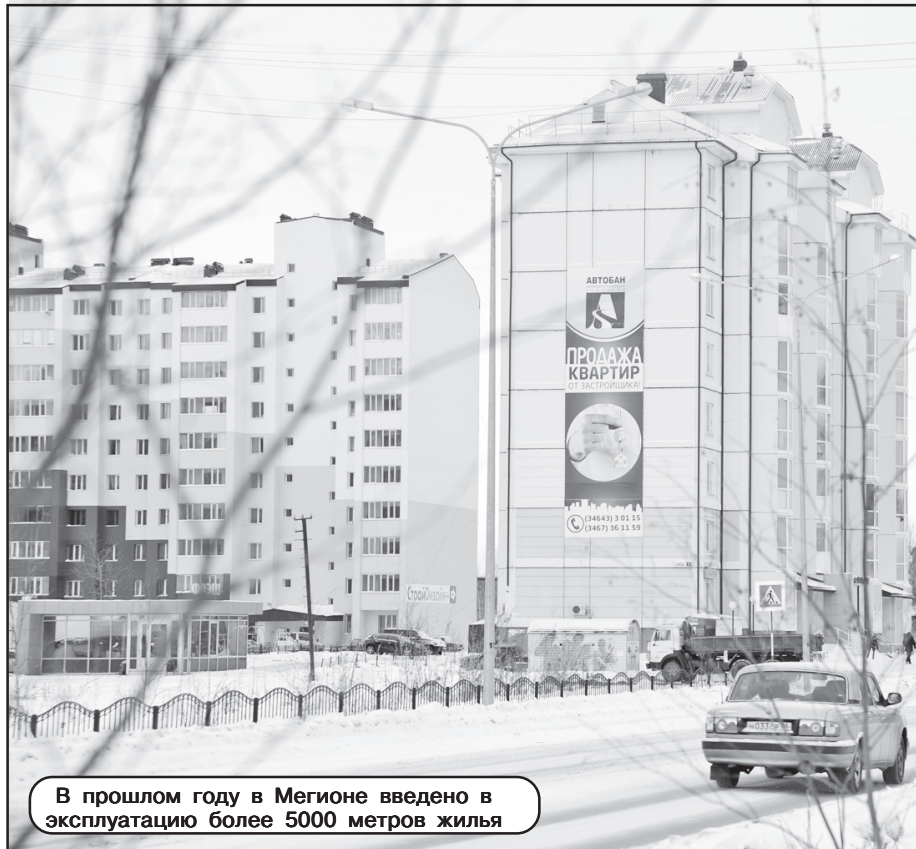
В прошлом году в Мегионе введено в эксплуатацию более 5000 метров жилья

- Сейчас доля предприятий малого и среднего бизнеса у нас составляет около 20 %, хотя в 2009-м было не более 16 %. В 2011 году у нас начала работать муниципальная программа поддержки малого бизнеса, из местного бюджета за 9 месяцев 2012 года было выделено 1 млн. 300 тысяч рублей и из окружного бюджета - ещё более 4,5 млн. рублей. Наши предприниматели участвуют в различных конкурсах, получают гранты. Активно развивается, например, такое направление, как частные детские сады, люди в этом заинтересованы. Также у нас работает предпринимательство окружного Бизнес-инкубатора, это тоже своего рода поддержка начинающих предпринимателям.