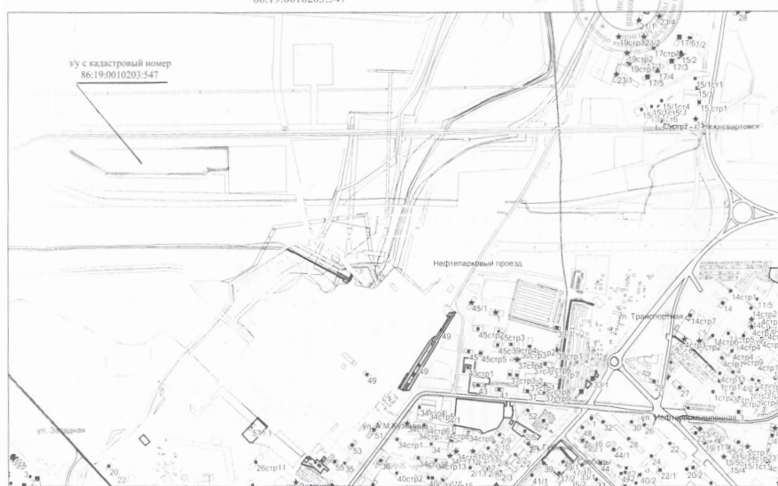
Приложение к постановлению администрации города Мегиона от 20.11.2017 № 2304