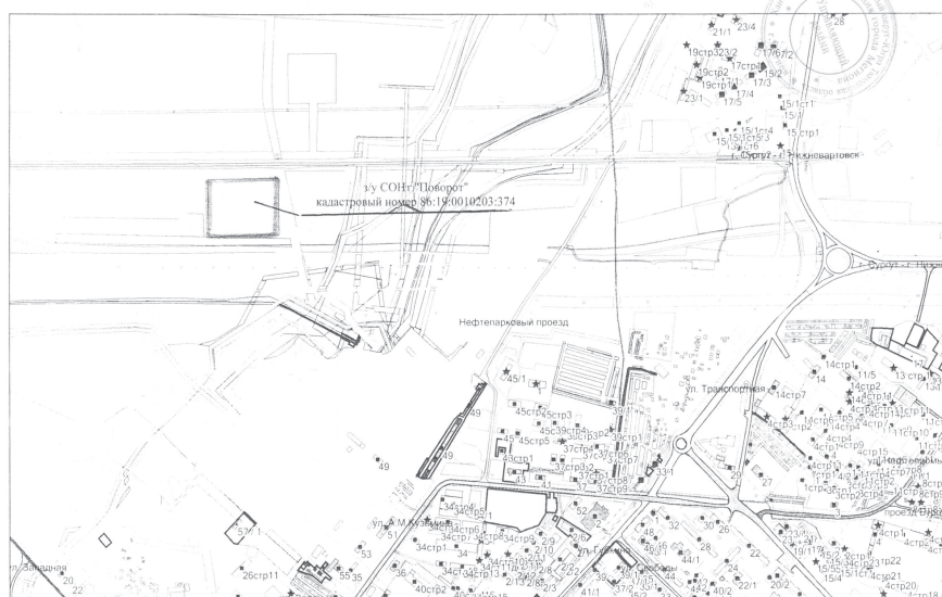
Приложение к постановлению администрации города Мегиона от 20.11.2017 № 2303