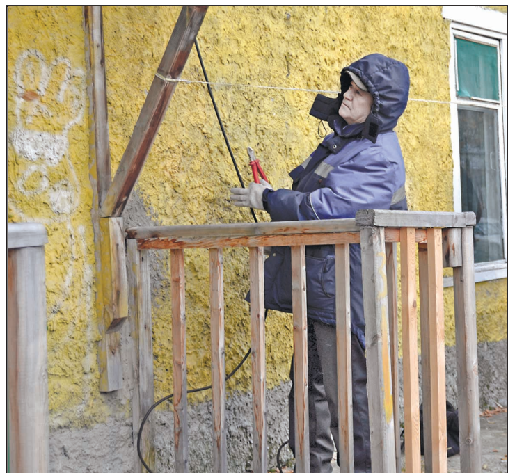
Отключение самовольного подключения к электроснабжению.

- К СОЖАЛЕНИЮ , не все понимают, что электроэнергия - это такой же товар, за который нужно платить. В настоящее время просроченная задолженность физических лиц составляет 12 миллионов рублей. Самый большой долг, числящийся за гражданином, - более 100 тысяч рублей.