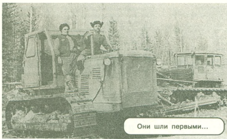
Они шли первыми...