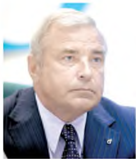
Юрий Важенин, член Совета Федерации от Югры:

На развитие инфраструктуры в Югре работают семь национальных проектов, реализуются национальные цели развития. Так, в их рамках построено 82 километра дорог, еще 211 - отремонтировали. Повышается качество водоснабжения - сейчас реконструируются водоочистные сооружения в Пыть-Яхе и Лянторе. Строятся школы и детские сады. Регион избавляется от непригодного жилья.