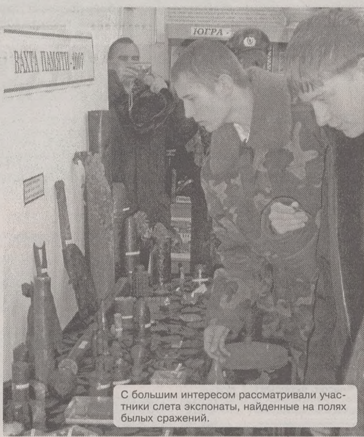
С большим интересом рассматривали участники слета экспонаты, найденные на полях былых сражений.