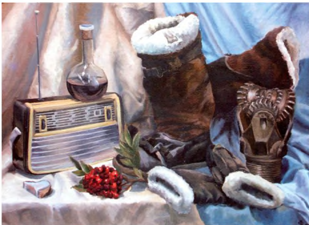
«Черное золото Соловков» - картина Федотовой Е.В., масло , холст