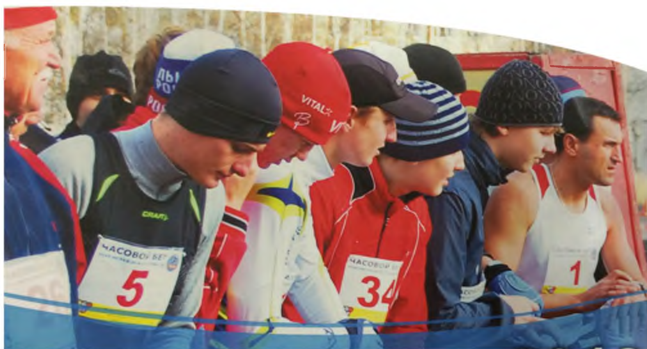
2014 г. Нижневартовск, на старте пробегача члены клуба "Марафонец"