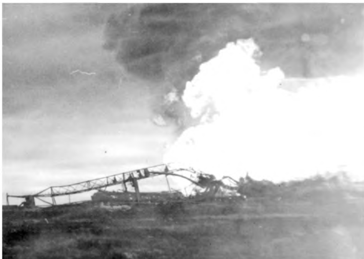
1972 год — аварийный фонтан на скважине Р-6 Варьеганской площади Мегйонской НГРЭ