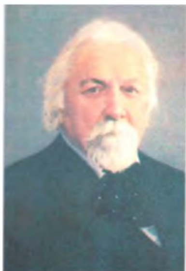
А.П. Карпинский Президент VII МГК 1897.