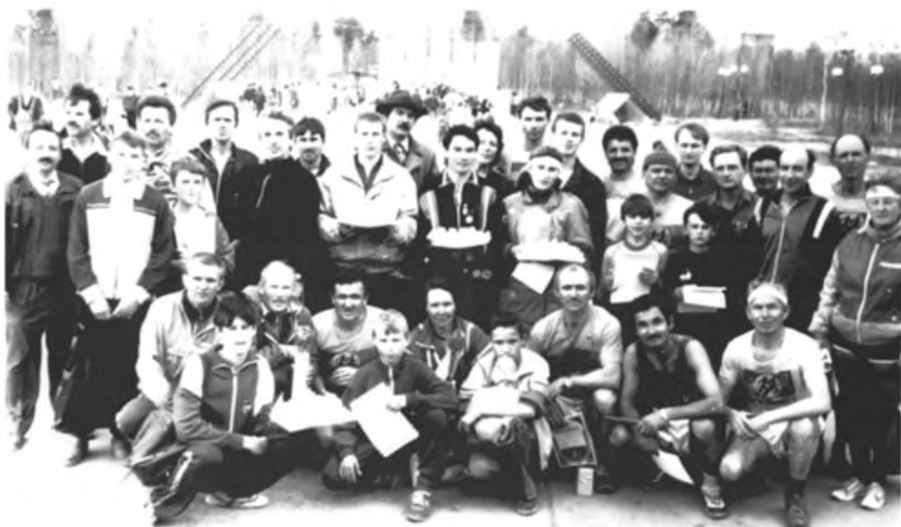
Члены клуба "Самотлор" в парке Победы. Страницы истории КБ "Марафонец", Нижневартовск. (с 1980 по 2002 гг. - КЛБ "Самотлор")