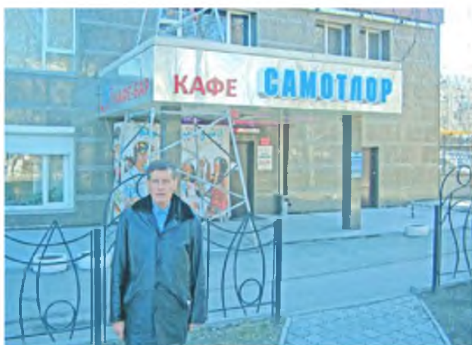
После вкусного обеда