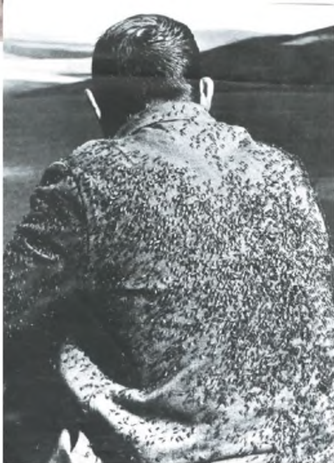
Живем в комарином краю