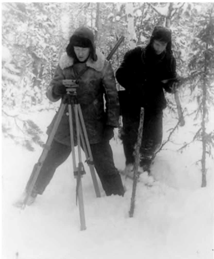
1963 год. На Самотлорском профиле топографы Сургутской геодезической партии № 49