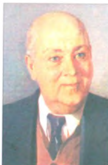
А.Е. Ферсман Генеральный секретарь XVII МГК 1937.