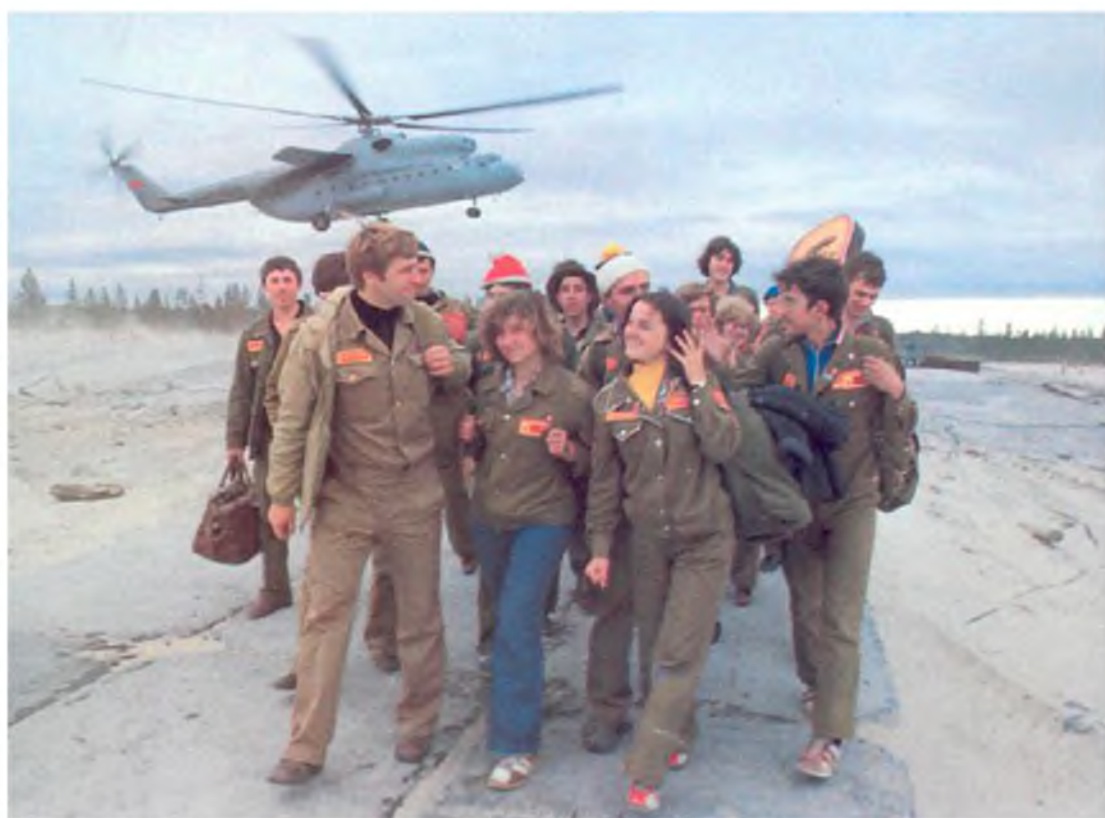
Десант яростного стройотряда на Самотлор