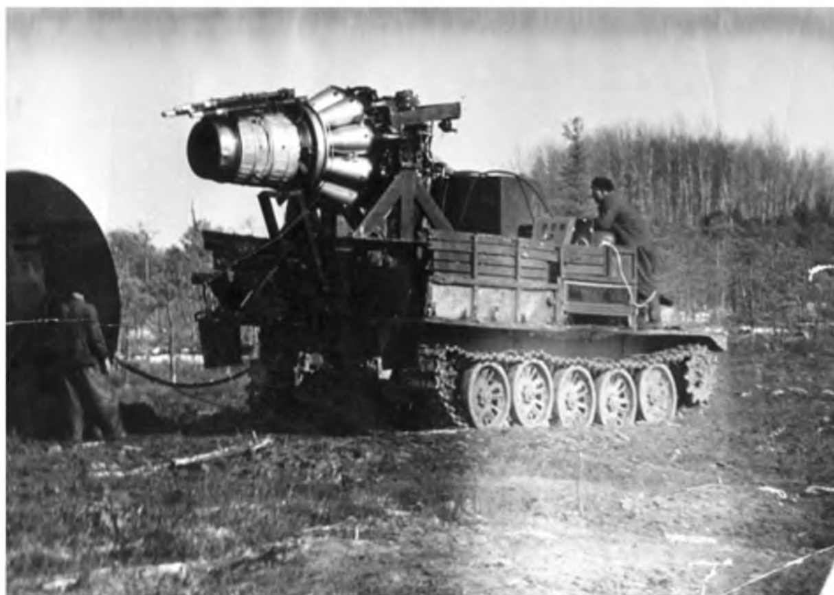
Реактивная пушка для укрощения нефтяного фонтана на скважине Р-6 Варьеганской площади