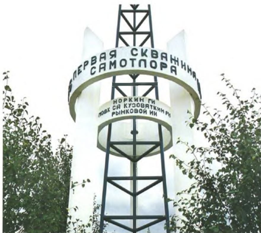
Первая Самотлорская разведочная скважина