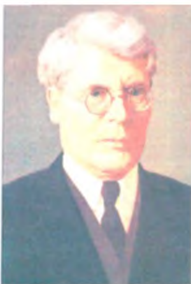
И.М. Губкин Президент XVII МГК 1937.