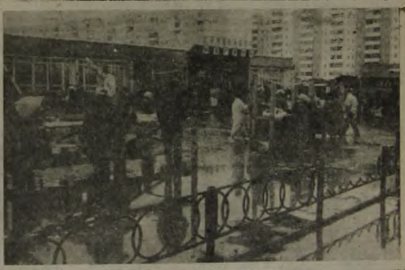
"Деловая часть" города

А может, они газету нашу не читают, некада?