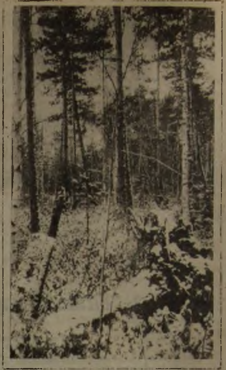
Таига примеряет зимний наряд

выясниться на Малый совет. Но комиссию даже не всегда