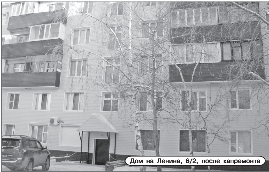
Дом на Ленина, 6/2, после капремонта