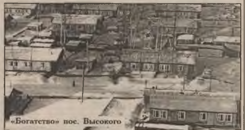
«Богатство» пос. Высокого

В этом году 22 семьи высококовцев вступили в окружную программу по ликвидации ветхого жилого фонда и в марте 2005 года получат жилье в Мегионе. 4 семьи уже получили квартиры, до конца года еще 4 семьи улучшат свои условия, получив капитальное жилье в поселке Высоком, по этой же программе. 22 семьи участвуют в долевом строительстве в Мегионе, в 144-квартирном доме. В основном это семьи нефтяников, бюд-