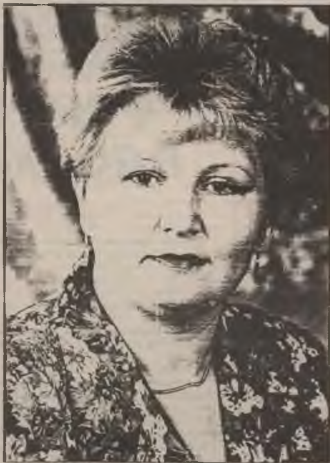
Кандидат на звание «Человек года»

Проблемы учеников, учителей - ее проблемы. Она радуется и огорчается вместе с ними. Хоро-