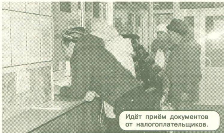
Идёт приём документов от налогоплательщиков.

Увеличивается и количество сдаваемых налоговых деклараций. В этом году физические