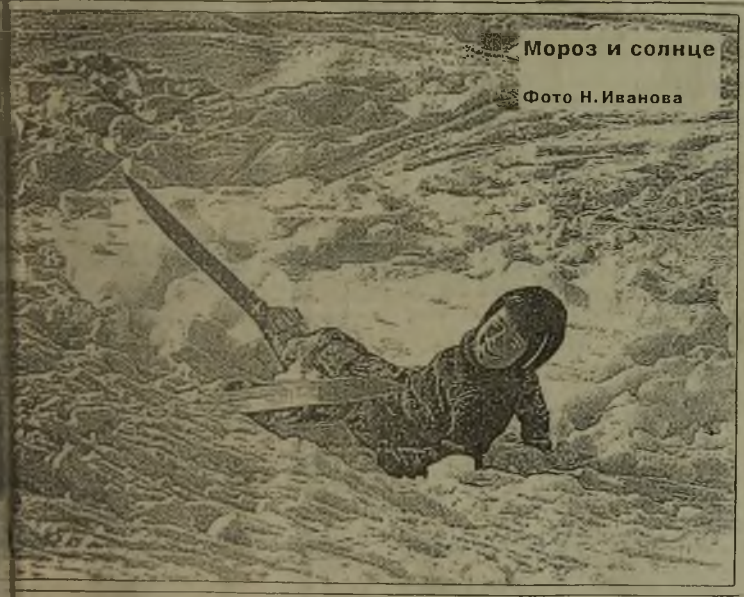
Мороз и солнце

— Я не утверждаю, что твоя мать глорх готовится, — говорит жених невесте, — но я, кажется, начинаю понимать, почему вы все молитесь перед обедом.