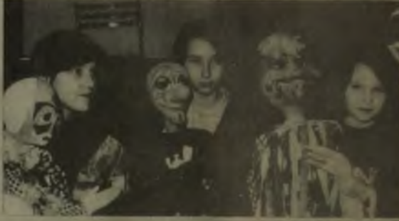
Кукольный театр "Колокольчик" при Мегнонском доме творчества хорошо известен в городе.