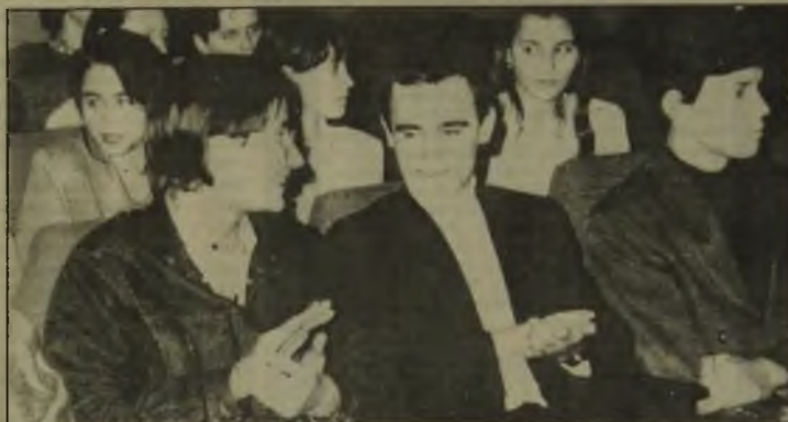
В субботу, 2 декабря, в СШ N 4 поздравляли победителей городской олимпиады.