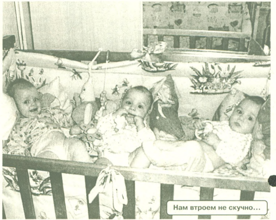
Нам троим не скучно...