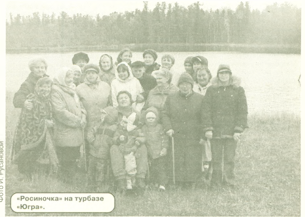
«Росиночка» на турбазе «Югра».

В этот день каждый мог найти развлечение по своему настроению. И, не слышно было слов "не могу",