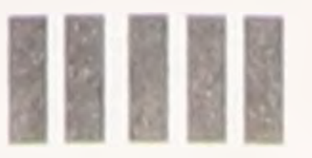
Приложение 12 к решению Думы города от 07.12.2010 № 100