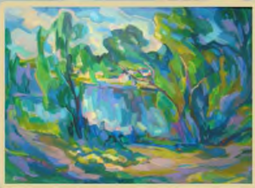
«У пруда» 50 х70, холст, акрил. 2010г.