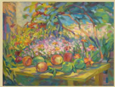
«Хвалынские яблоки» 60х80, холст, масло. 2010г