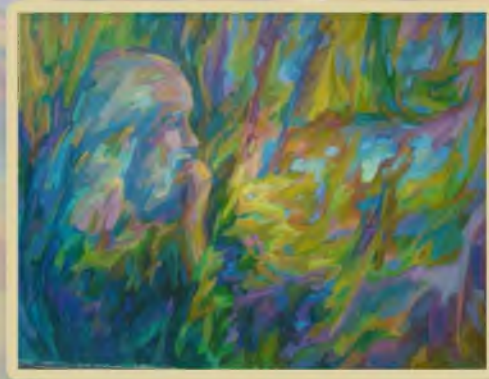
«Мыслитель» 60х80, холст, масло. 2011