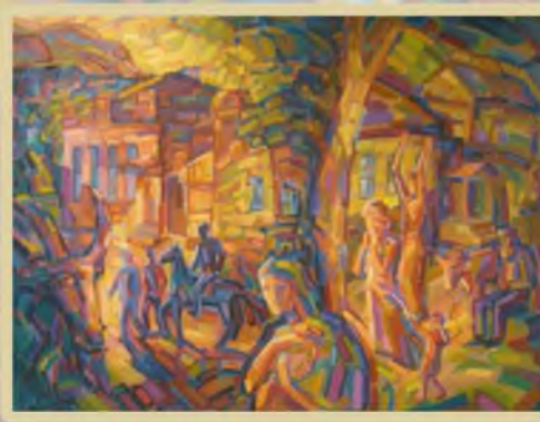
«Хвалынская история» 60х80, холст, масло. 2006г