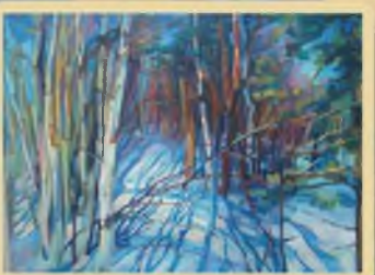
«В зимнем лесу» 60x80 холст, масло. 2011г.