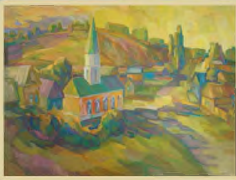
«Пейзаж с мечетью» 60х80, холст, масло. 2011