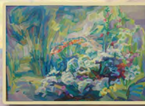
«Цветочная композиция» 50х70, холст, масло.