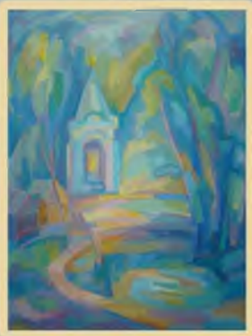
«У святого источника» 60x80, холст, масло.