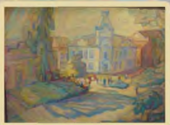
«Жаркое лето в Хвалынске» 60x80, холст, масло. 2006г.