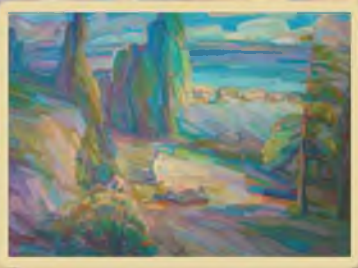
«На Волжских холмах» 60x80, холст, масло. 2011