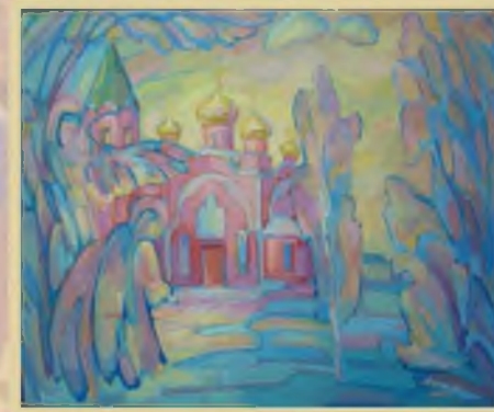
«Рождество в Мегионе» 50х60, Холст, масло