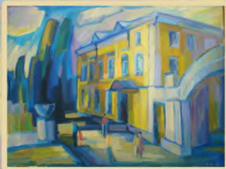
«Дом Радищева в Хвалынске» 60х80, холст, масло. 2010г.