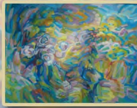
«Цветочный вальс» 60х80, холст, масло.