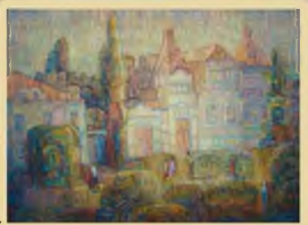
«Хвалынский купеческий» 60x80, холст, масло. 2007г.