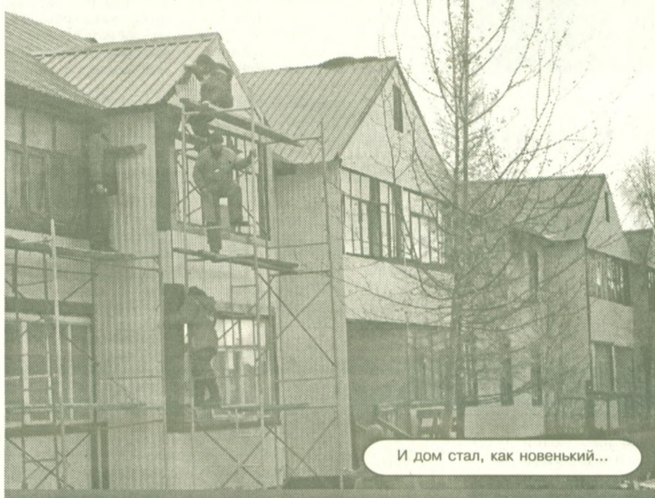
И дом стал, как новенький...