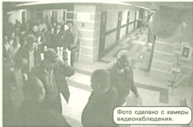
Фото сделано с камеры видеонаблюдения.

Наблюдатели от партии ЛДПР говорят, что избирателей, которые являются вахтовыми работниками "СН-МНГ" и в день выборов должны быть на отдаленных месторождениях, подвозят на автобусах. По их мнению, этим нарушают Федеральный закон "Об основных гарантиях избирательных прав и права на участие в референдуме граждан Российской Федерации", прямо запрещающий зарегистрированным кандидатам, избирательным объединениям, доверенным лицам и уполномоченным представителям, а также организациям, членам органов управления или органов контроля, иным физическим и юридическим лицам, действующим по просьбе или по поручению указанных лиц и организаций,