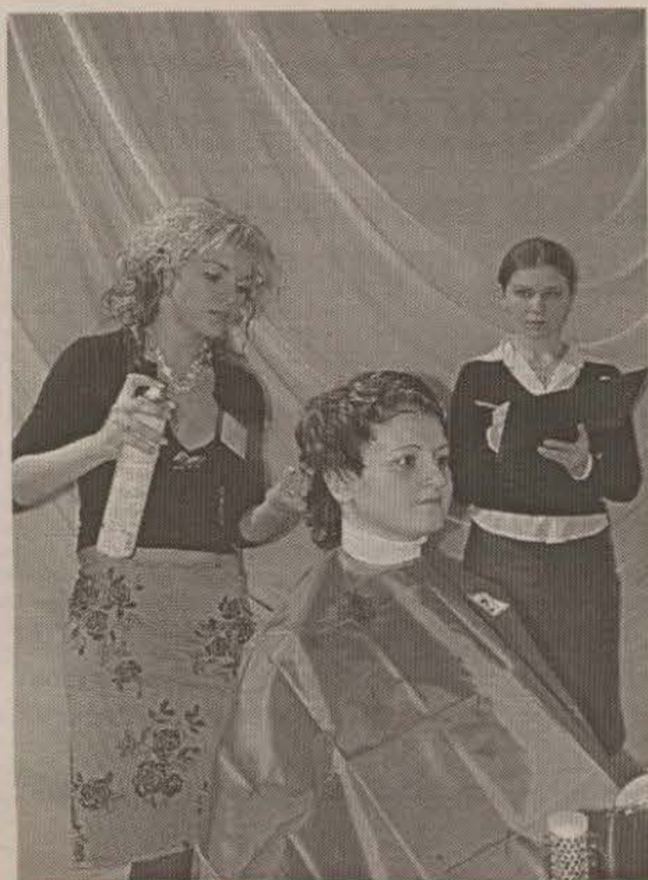
Во время конкурса «Мегионский цирюльник»