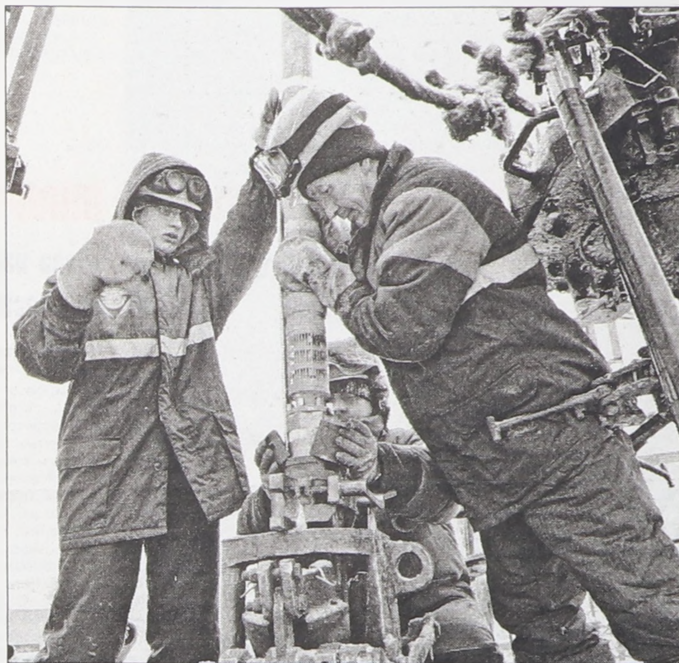
«РУ-Энерджи КРС-МГ» планирует увеличение прибыли в четвёртом квартале этого года

уже достигнута договорённость с нашими партнёрами из Китая о поставке новых буровых станков, насосных блоков, систем очистки. Ждём поставку первых 5 станков (от 120 до 160 тонн) уже в январе. И в последующие месяцы до апреля, надеюсь, будем получать по 5 буровых станков. К началу мая должны взять на вооружение 20 буровых станков совершенно новых, начиная от станка КРС, кончая гаечным ключом, - комплексная поставка.