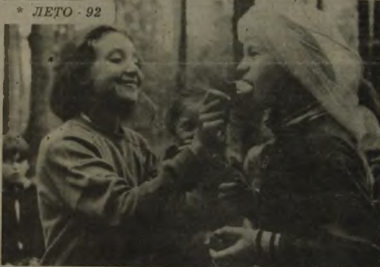
* ЛЕТО - 92

* "Британтний" - это здорово! - такое мнение детей, которые провели лето в лагере под таким названием. Организован лагерь на базе Мегионского Дома пионеров и школьников. Целый вечер захватывающих конкурсов, игровых и спортивных программ - вот что вызвало живой интерес ребят.