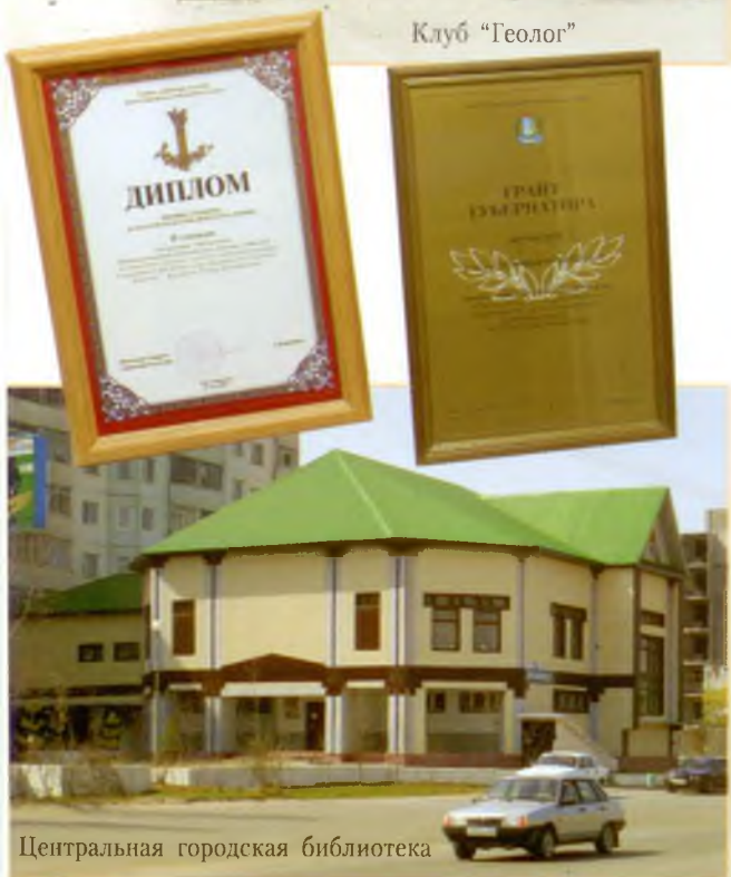
Центральная городская библиотека