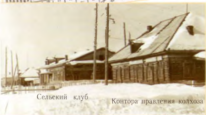
Сельский клуб Контора правления колхоза

...В протоколе № 5 заседания исполкома Ларьякского райсовета депутатов трудящихся Ханты-Мансийского округа от 06.04.1954 года содержится решение открыть с 01 июля 1954 года в Мегионе библиотеку.