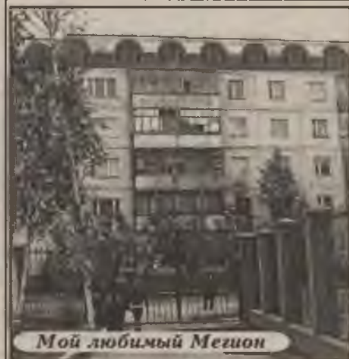
Мой любимый Мегион

лых осложнений, по мнению врачей, уберезет. 3 тысячи доз вакцины «Гриппол» уже поступило в поликлинику для взрослых, для детей по плану предусмотрено 5 тысяч доз. Все желающие могут поставить укол в прививочных кабинетах поликлиники, с 8 до 18 часов. Вакцинация продлится до 1 декабря, позднее делать прививку нет смысла, так как иммунитет не успеет выработаться до пика заболеваемости гриппом, который ожидается в февралемарте.