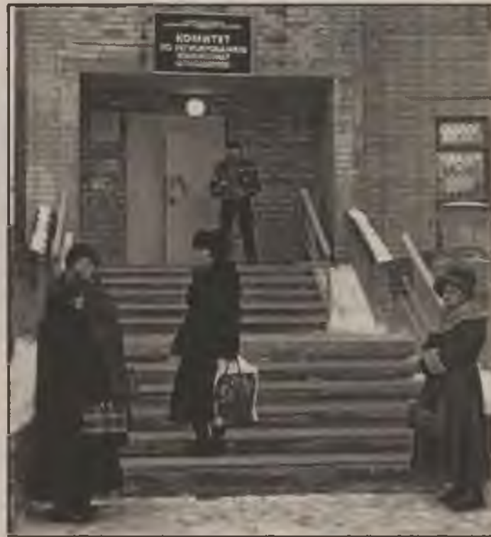
Мегионцы стремятся быстрее приватизировать свое жилье

Бесплатная приватизация квартир прекратится в 2007 году. Такое решение приняли депутаты Госдумы. Это правило будет действовать только для тех, кто уже получил или получит до конца текущего года бесплатную квартиру от государства. Тем, кто решится на приватизацию, предстоит платить налог на недвижимость. Его размеры также утверждаются новым Жилищным кодексом.