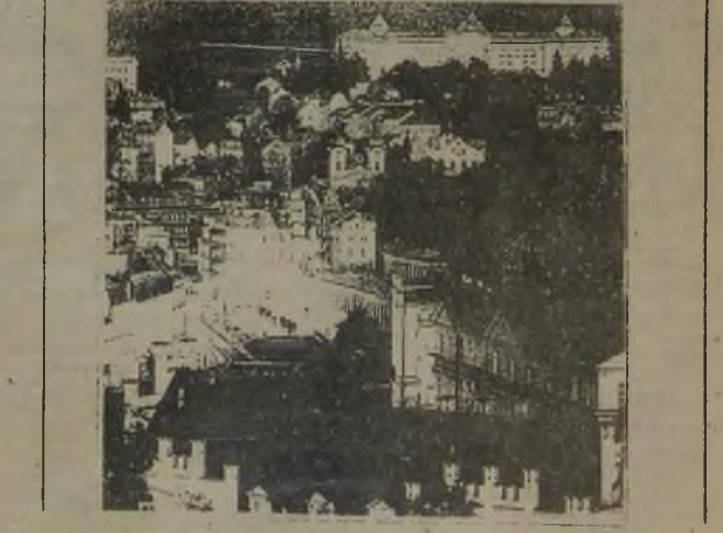
Материал подготовила Наталья ВЛАСЕНКО

других городов Чехо-Словакии. Стоимость путевки зависит от категории. Самая высокая цена 8 тысяч крон, низкая 5 тысяч. В санатории в сфере обслуживания и медицины работают 180 человек. - Русские пациенты отличаются от клиентов других стран? - Сейчас уже нет. Изменилось поведение, манера держаться. Стиль одежды приблизился к европейскому. Отношение с окружающими стали лучше, раскованней. А, в общем-то, работники "Империла" симпатизируют русским. С нами всегда хочется общаться. Вы очень открыты и добросердечны.