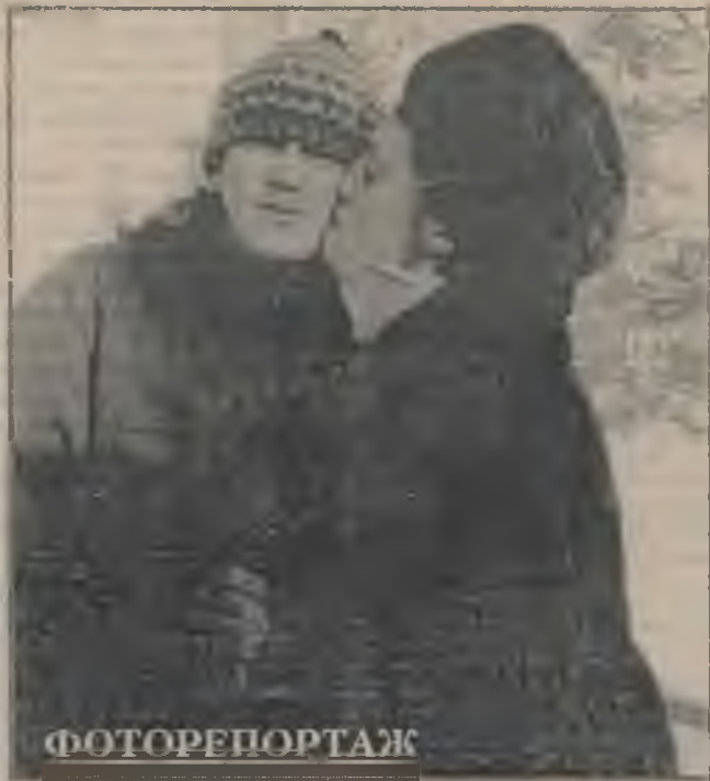
различных воинских частей на всей территории России. Так пожелаем им удачи в их нелегкой, солдатской службе.

12 ноября отправился в армию первый осенний призыв из Мегиона. Шестеро юношей, проживающих в городе, и трое - из поселка Высокий станут солдатами