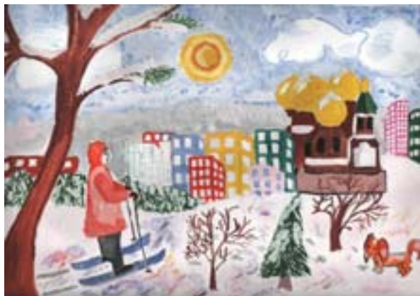
Шагаповой Земфиры, 12 лет. На лыжной прогулке Бумага, гуашь