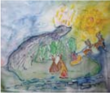
Галандарова Сутра, 13 лет. Вороний праздник Батик