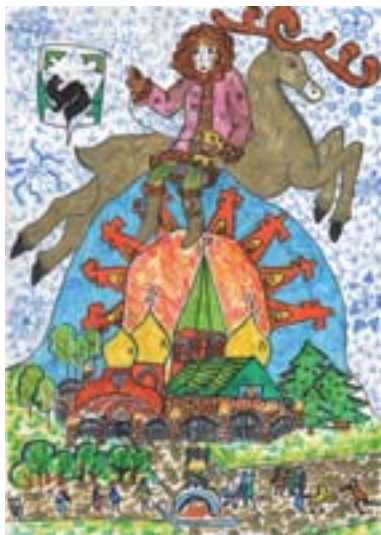
Михайленко Дарья, 13 лет. Мегион – северный город Бумага, гуашь, фломастер