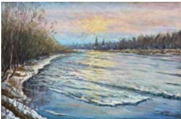
Шлябин Дмитрий. Апрельские забереги Холст, масло