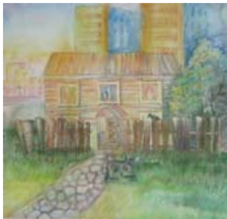
Магадеева Юлия, 14 лет. Уютный дворик. Графика