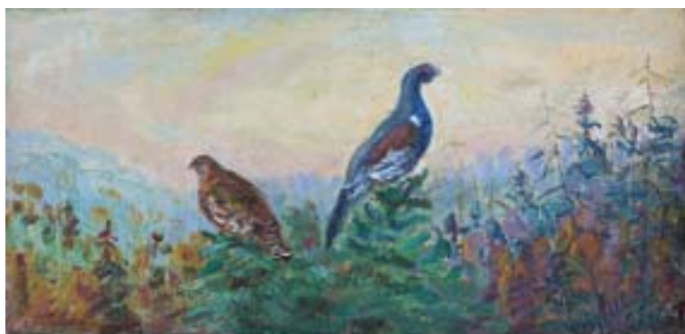
Шлябин Дмитрий. Глухари Холст, масло