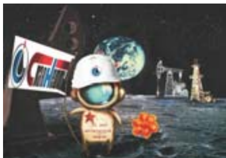
Варнавская Анна, 15 лет. Мегионский нефтяник на Луне, или Мы - Вселенная, мы - Космос. Компьютерная графика