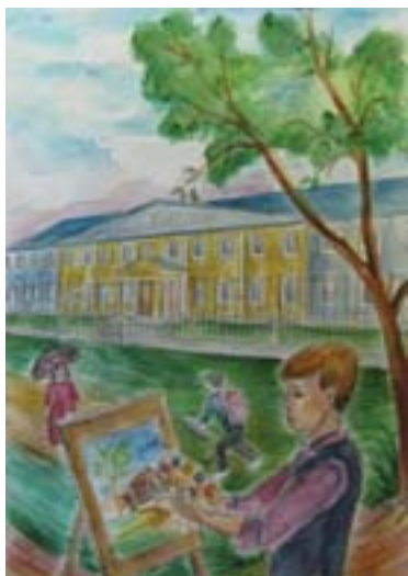
Зайнуллина Гульдара, 15 лет. Любимый город Смешанная техника