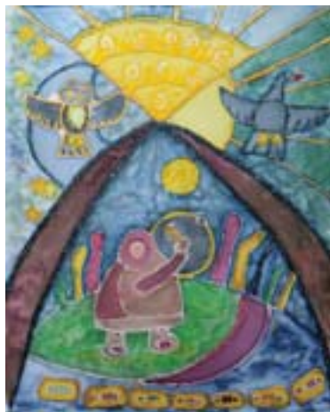
Ганжа Ксения, 13 лет. Шаман Батик