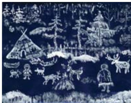
Огорелков Аркадий, 10 лет. На стойбище Графика