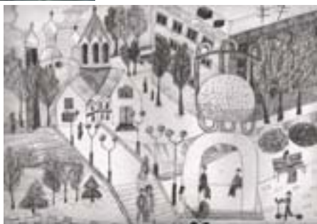
Винокурова Катя, 14 лет. Мой город Графика