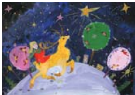
Синявская Софья, 9 лет. Сказочный Мегион Бумага, гуашь