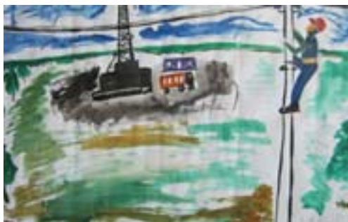
Кадралев Тимур, 9 лет. На буровой Бумага, гуашь