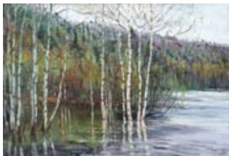
Шлябин Дмитрий. Культур-Еган. Половодье ДВП, масло