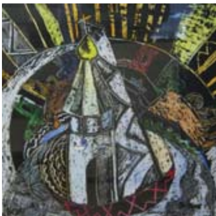
Билялова Алма, 13 лет. Наш город Бумага, гуашь