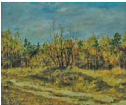
Мингалиева Лена. Тропинка в лесу Холст, масло