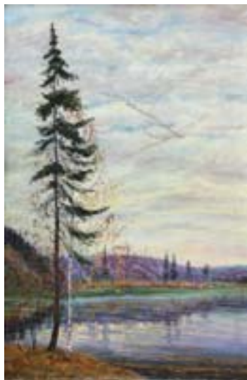
Шлябин Дмитрий. Осенняя песнь Холст, масло