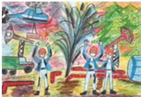
Илкина Лиза, 10 лет. Нефть пошла Восковые мелки