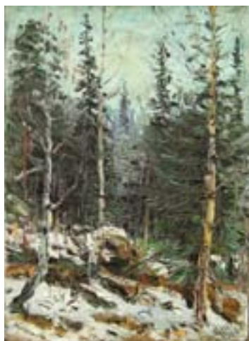
Шлябин Дмитрий. Пробуждение Этюд. Холст, масло