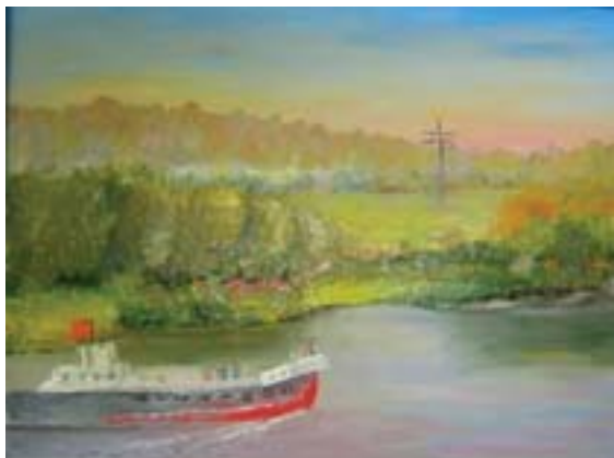
Корзан Яна. Вечерний рейс Холст, масло