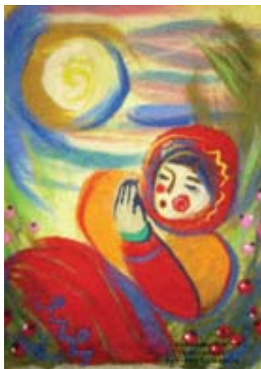
Кабирова Рамиля Клюквинка Валяние на шерсти