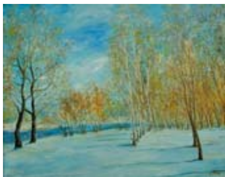
Мингалиева Лена. Зимний пейзаж Холст, масло