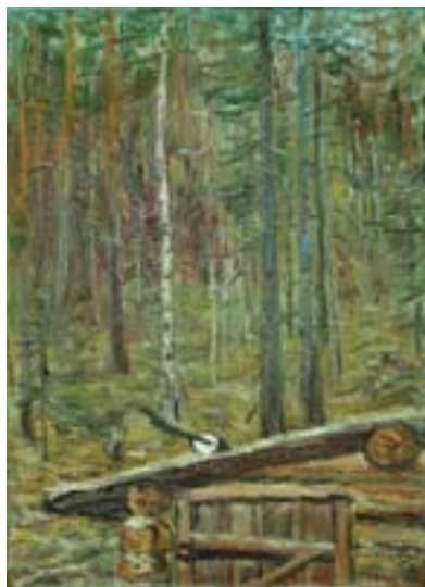
Шлябин Дмитрий. Зимовье Картон, масло