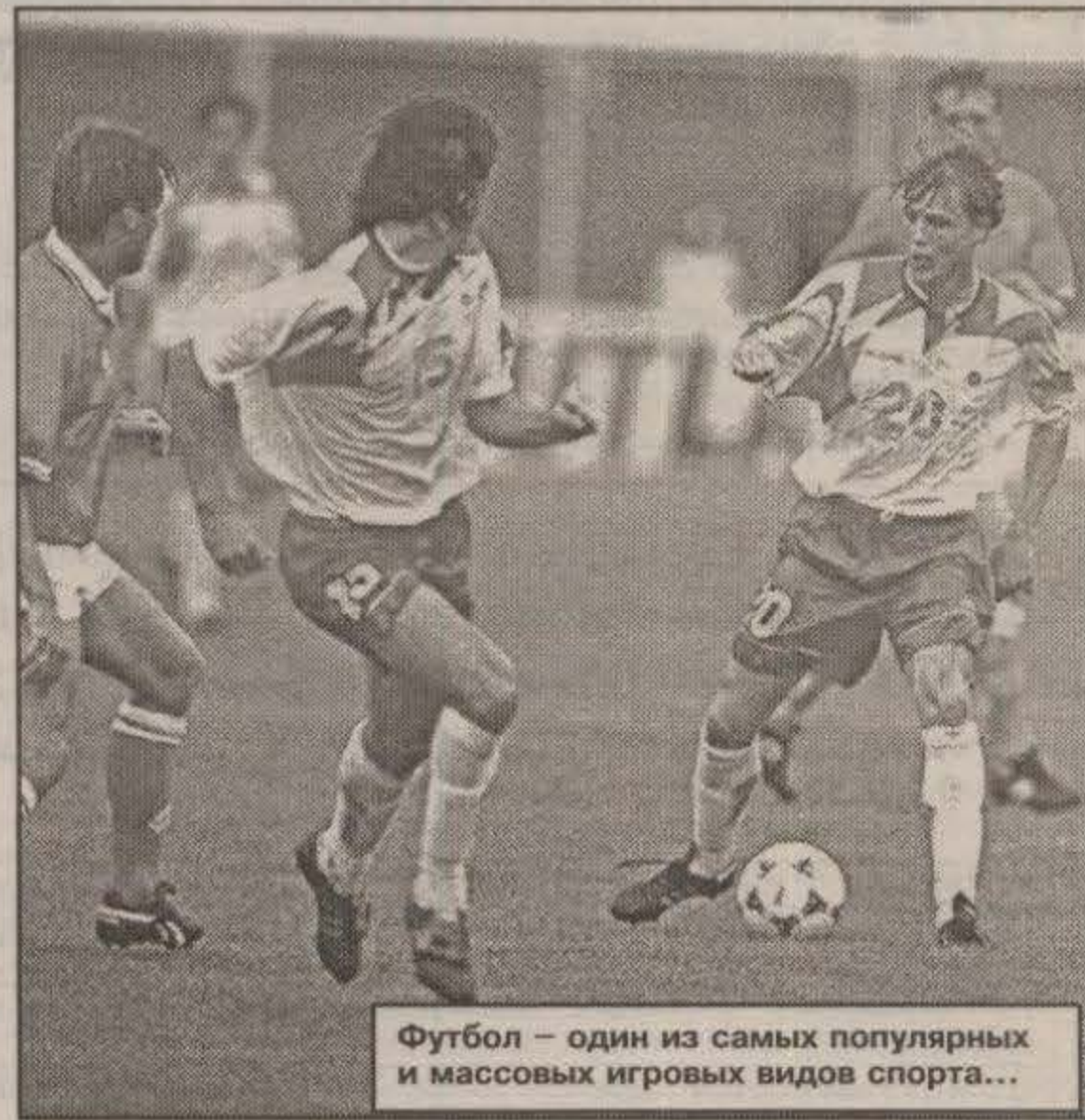
Футбол — один из самых популярных и массовых игровых видов спорта...

По итогам зональных соревнований на Первенстве России по мини-футболу во втором туре команда ДЮСШ №1, представлявшая сборную Мегиона, вошла в тройку лидеров по количеству набранных очков, имея хороший задел для следующего, третьего, тура, который пройдет во время зимних школьных каникул.