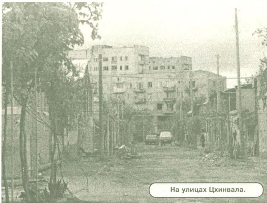
На улицах Цхинвала.

Через двести с лишним лет от того исторического события Южная Осетия оказалась на исходных позициях. Северная часть благополучно