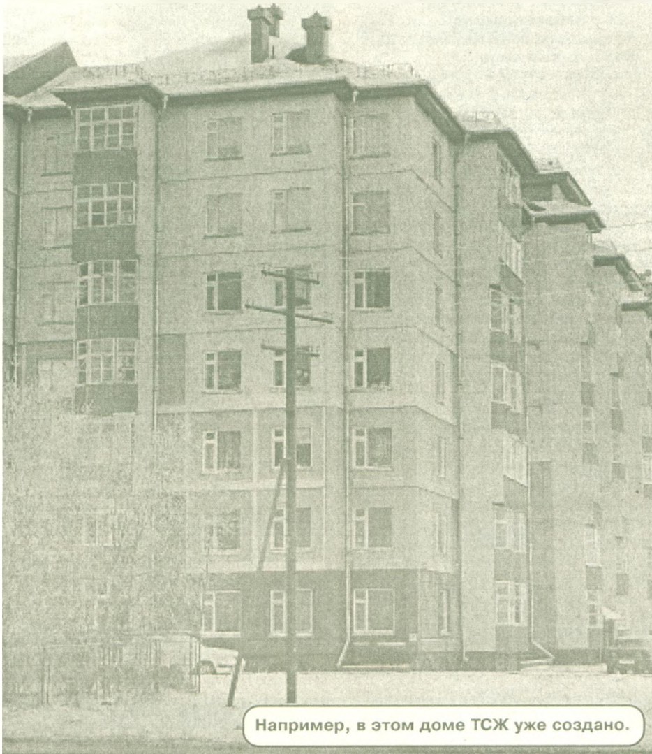
Например, в этом доме ТСЖ уже создано.

- Почему так трудно идет процесс создания ТСЖ: люди должны «дозреть»?