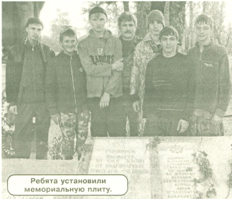
Ребята установили мемориальную плиту.

И вот в 2008 году составившаяся в одиночестве, так никогда и не вышедшая замуж вдова получает письмо из города Севска, о существовании которого даже не подозревала. А в нем записка с ее адресом и фамилией, написанная рукой ее мужа. Бумага пожелтела от давности и