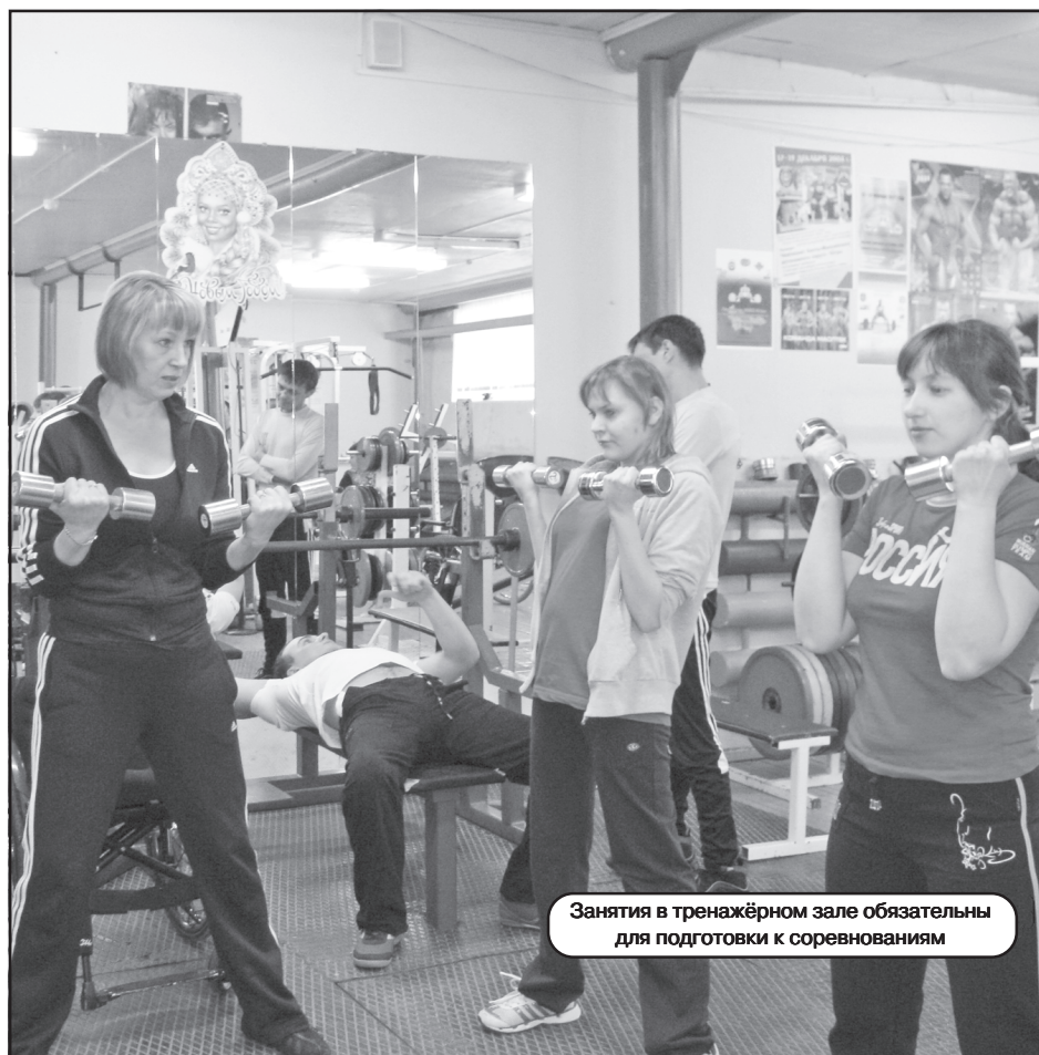
Занятия в тренажёрном зале обязательны для подготовки к соревнованиям

За долгие годы упорных тренировок спортсмены вместе с тренером добились не только спортивных успехов, но и одержали самую главную победу - победу над собственными недугами: к примеру, те, кому по медицинским показаниям нельзя