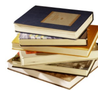
Пояснительная подпись под рисунком

у американской компании «Films by Jove» коллекцию классических анимационных фильмов «Союзмультфильма» и подарил ее российскому детскому телевизионному каналу «Бибигон». Сумма сделки оценивается в пять-десять миллионов долларов. На счету Алишера Усманова также выставка «Прерафаэлиты: викторианский авангард» и выставка Уильяма Тёрнера в ГМИИ им. А. С. Пушкина, финансирование издания журнала «Мурзилка», поддержка проектов Владимира Спивакова, организация Международного конкурса теноров памяти Лучано Паваротти.