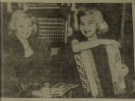
«ЕЛОЧКЕ» ТАНЦЕВАТЬ ЛЮБЯТ