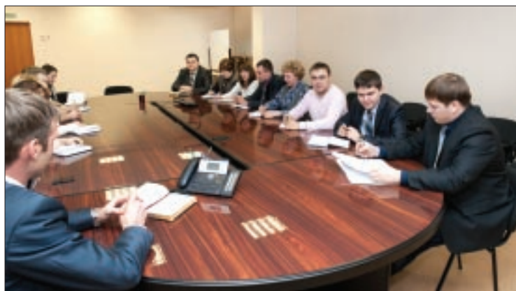
Коллективное обсуждение производственных вопросов — часть работы геологов. Задачи, которые решают разные отделы геологической службы, взаимосвязаны и нацелены на повышение эффективности эксплуатации месторождений

Елена НОВОСЕЛОВА.