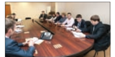
ДОБЫЧА НЕФТИ ПОД КОНТРОЛЕМ ГЕОЛОГОВ стр. 2