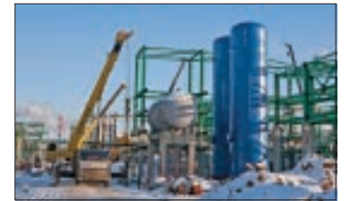
МОДЕРНИЗАЦИЯ ПРОДОЛЖАЕТСЯ стр. 2