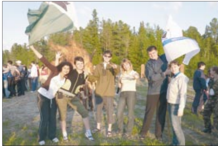
Молодые специалисты «Мегионнефтегаза» – в числе участников форума югорский «Селигер»

Участники форума посещали занятия образовательного блока, который был направлен на развитие и поддержку творческого потенциала молодежи. Ведущие специалисты из Москвы и Тулы проводили семинары-лекции по трем направлениям: «Применение эффективных механизмов в управлении», преподаватель – кандидат психоло-