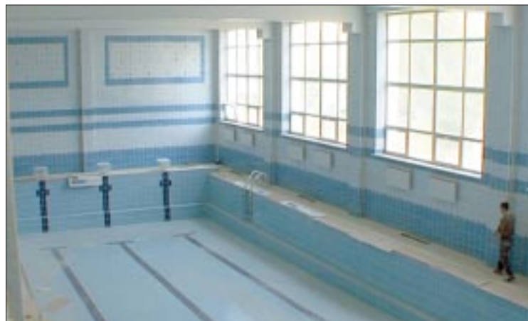
Новая школа – первая в Мегионе, где есть собственный плавательный бассейн

– Это уникальный объект по своей архитектуре, – говорят строители. – Насколько мы знаем, та-