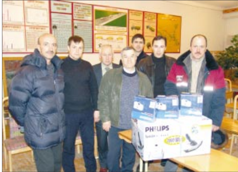
Победители конкурса — команда ООО «НефтеСпецТранс». По общему мнению, залогом успеха стали уверенность в своих силах и сплоченность